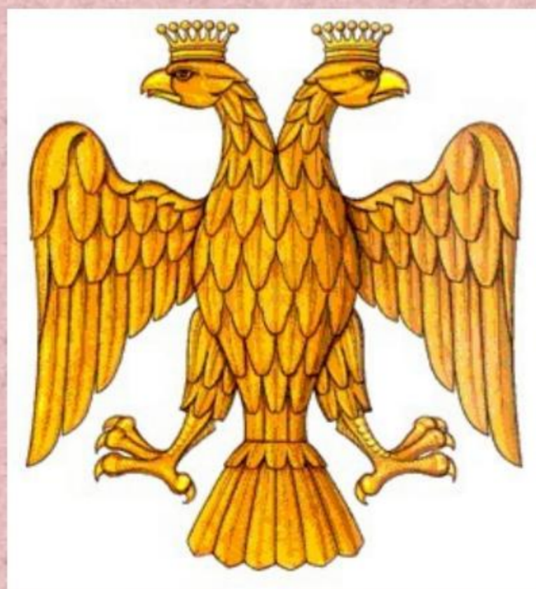
Герб России при Иване III