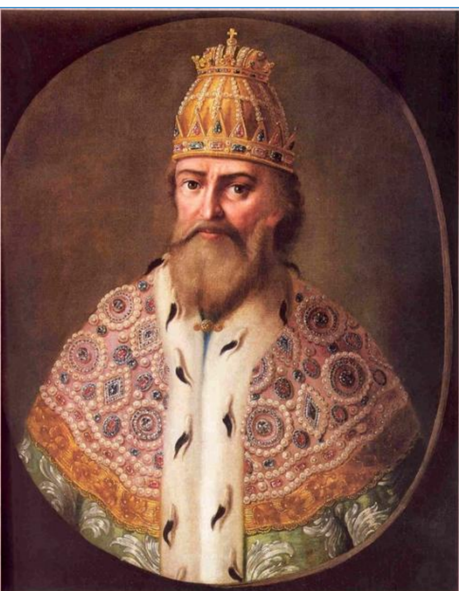
Князь Иван III

Битва на реке Шелонь в 1471 году. В 1471 г., возмущенный действиями новгородцев, Иван III тремя отрядами выступил на Новгород.