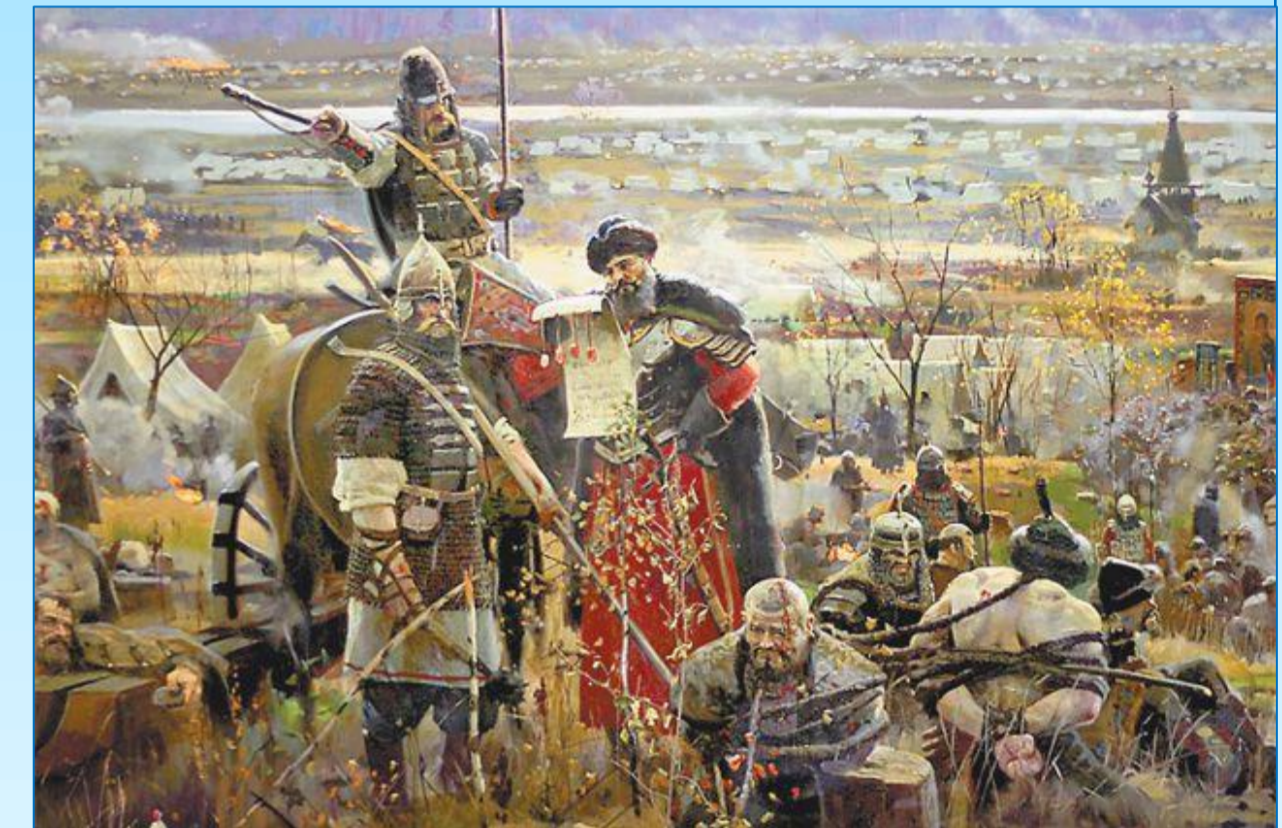
Хан Ахмат собирал войска для подавления воспрянувшей Руси